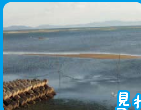
生き物の楽園! 干潟