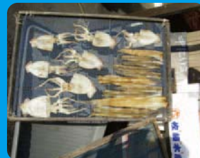
地元産の干物 地元の港でとれた魚介類の干物。まさに地産地消。おいしそう!