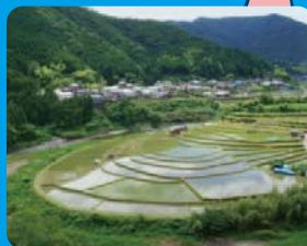
自然のジグソーパズル 河がUの字に曲った所にうまきはまった棚田。私のアートスポットです。