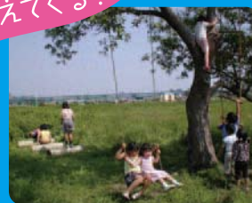
木一本の遊園地 1本の木が何人の子供を育てるのでしょうか。